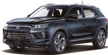
SPACE čierna (LAK)