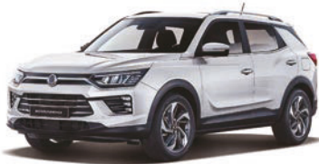
GRAND biela (WAA)