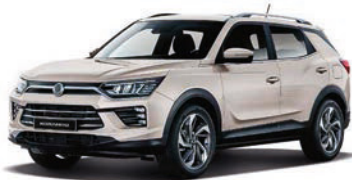
LATTE béžová (EBL)