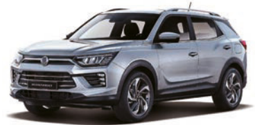
IRON kovová (ADE)