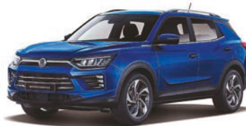
DANDY modrá (BAS)