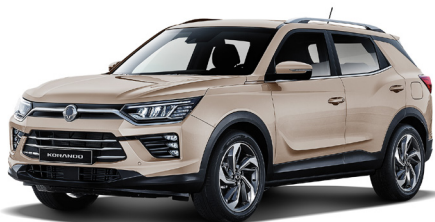
LATTE béžová (EBL)