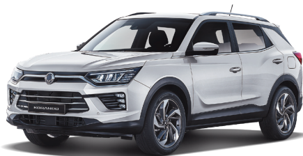
GRAND biela (WAA)