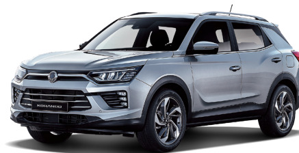
IRON kovová (ADE)