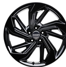
19" ALU disky, „Diamond Cutting“, pneumatiky 235/55 R19