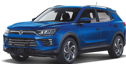
DANDY modrá (BAS)