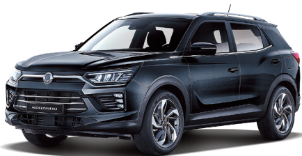
SPACE čierna (LAK)