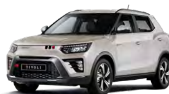
Metalická farba LATTE béžová (EBL)