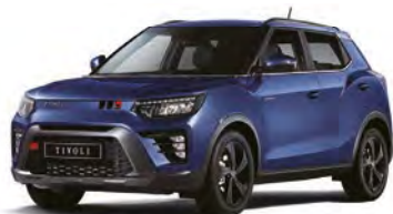
Metalická farba DANDY modrá (BAS)