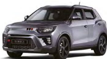
Metalická farba IRON kovová (ADE)