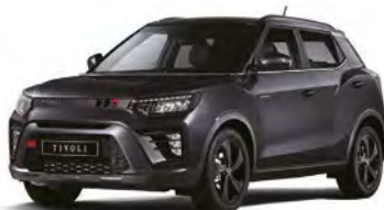
Metalická farba SPACE čierna (LAK)