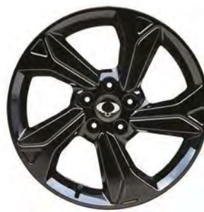
18" čierne ALU disky "Diamond Cutting", pneumatiky 215/50 R18