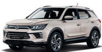
LATTE béžová (EBL)