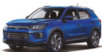
DANDY modrá (BAS)