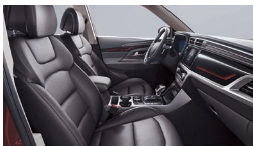
Čierna interiér (LBH)