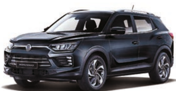
SPACE čierna (LAK)