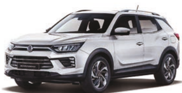
GRAND biela (WAA)