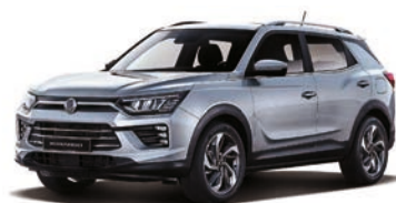
IRON kovová (ADE)