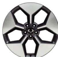
20" ALU disky "Diamond Cut"