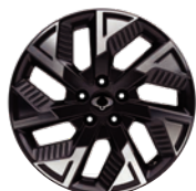
18" ALU disky "Diamond Cut"