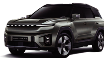
FOREST zelená s čiernou strechou (2GO)