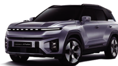
IRON kovová s čiernou strechou (2DE)