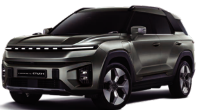
FOREST zelená (GAO)