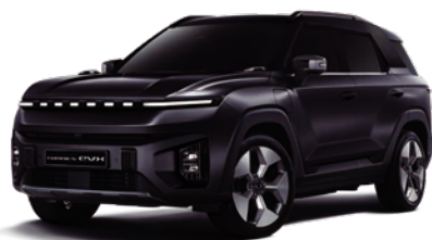
SPACE čierna (LAK)