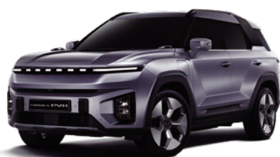
IRON kovová (ADE)