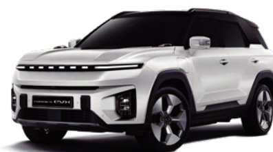
GRAND biela s čiernou strechou (2WA)