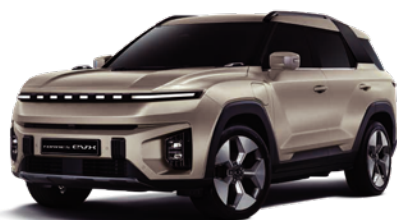
LATTE béžová (EBL)