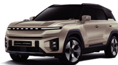
LATTE béžová s čiernou strechou (2BL)