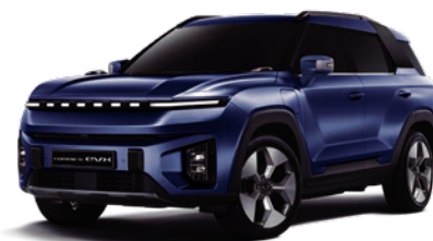
DANDY modrá (BAS)